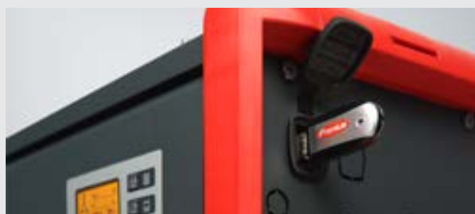
/ USB Schnittstelle