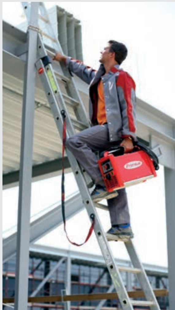
/ Ľahké a mobilné zariadenie, ktoré nájdeme na každej stavbe.