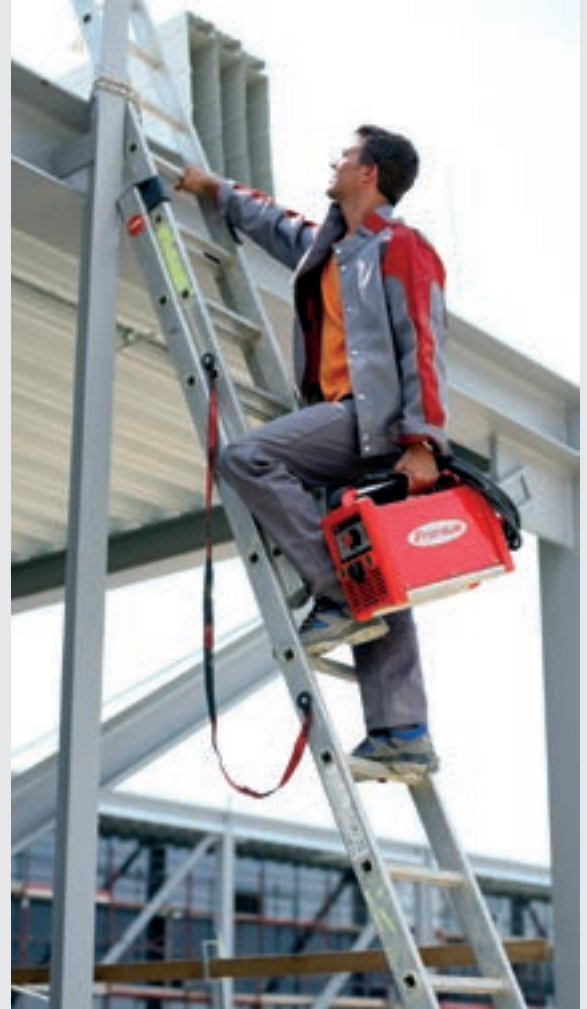
/ Hafif ve taşınabildir, bu sayede her yerde kullanılabilir.