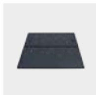
Cordón a tope