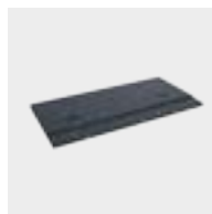
Junta de solapamiento