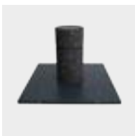
Conexión de tuberías

Cada tarea de soldadura requiere diferentes técnicas y habilidades manuales, por eso aprender las distintas posiciones de soldadura es una parte esencial de la formación en soldadura.