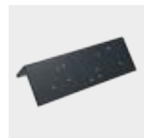
Cordón en esquina