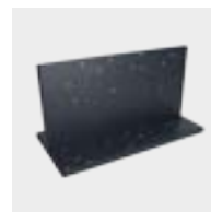
Cordón de garganta