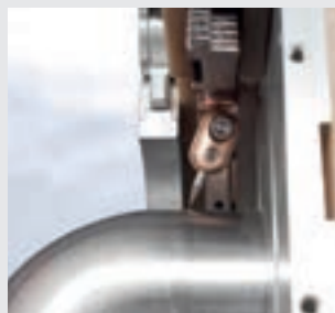
/ Otočný držiak elektródy pre rúrkové nástavcové aplikácie