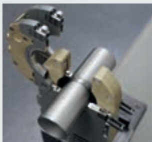
/ Dokonalé zvarové švy vďaka zatvorenej komore