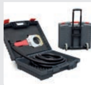
/ Prepravný kufor s vozíkom