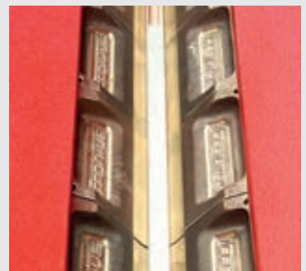
/ Einstellbare Spannbacken