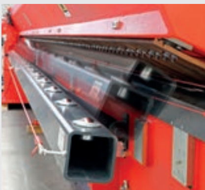
/ Unterstützungseinheit mit Rollen