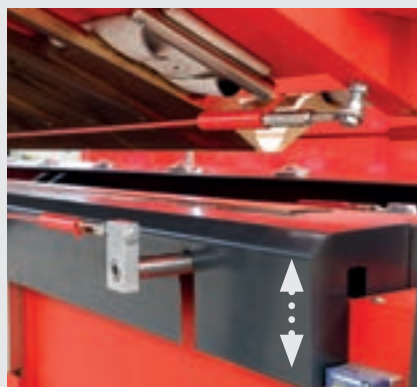
/ Höhenverstellbarer Spannholm