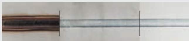
/ CrNi przed oczyszczeniem