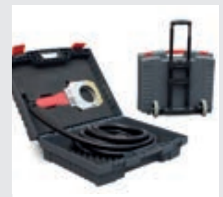
/ Transportkoffer mit Trolley