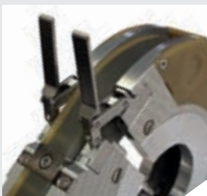
/ Federgelagertes Spannsystem