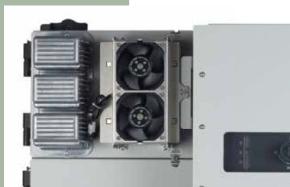
Unidade de energia substituível