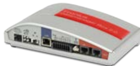
/ Fronius Datamanager Box 2.0