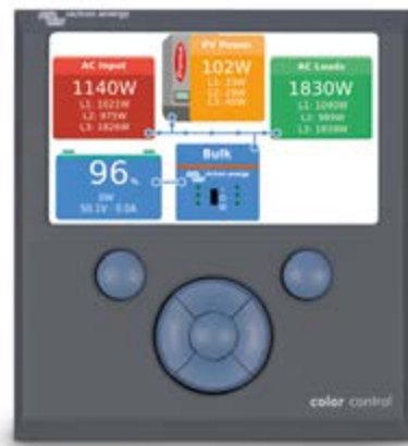
Victron Color Control Display