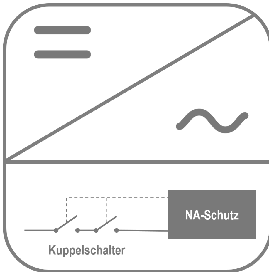
Abbildung 1: Wechselrichterintegrierter NA-Schutz bei Anlagen bis 30 kVA

Grundsätzlich hat jeder Wechselrichter einen Netz- und Anlagenschutz integriert. Der interne NA-Schutz misst die Netzspannung und die Netzfrequenz und schaltet die PV Anlage über die integrierten Kuppelschalter ab, sobald die Abschaltbedingungen erfüllt sind. Der Netz- und Anlagenschutz sowie der redundant ausgeführte Kuppelschalter befinden sich beide im Wechselrichter. Bei PV-Anlagen mit einer Leistung bis zu 30 kVA ist dieser NA-Schutz, welcher im Wechselrichter verbaut ist, ausreichend. Es wird also kein externer NA-Schutz benötigt.