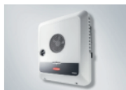
Symo GEN24 10.0

Tu GEN24 Plus está ahora registrado. Ahora puedes continuar directamente con la extensión de la garantía en nuestra tienda web haciendo clic en el botón „EXTENDER GARANTIA“