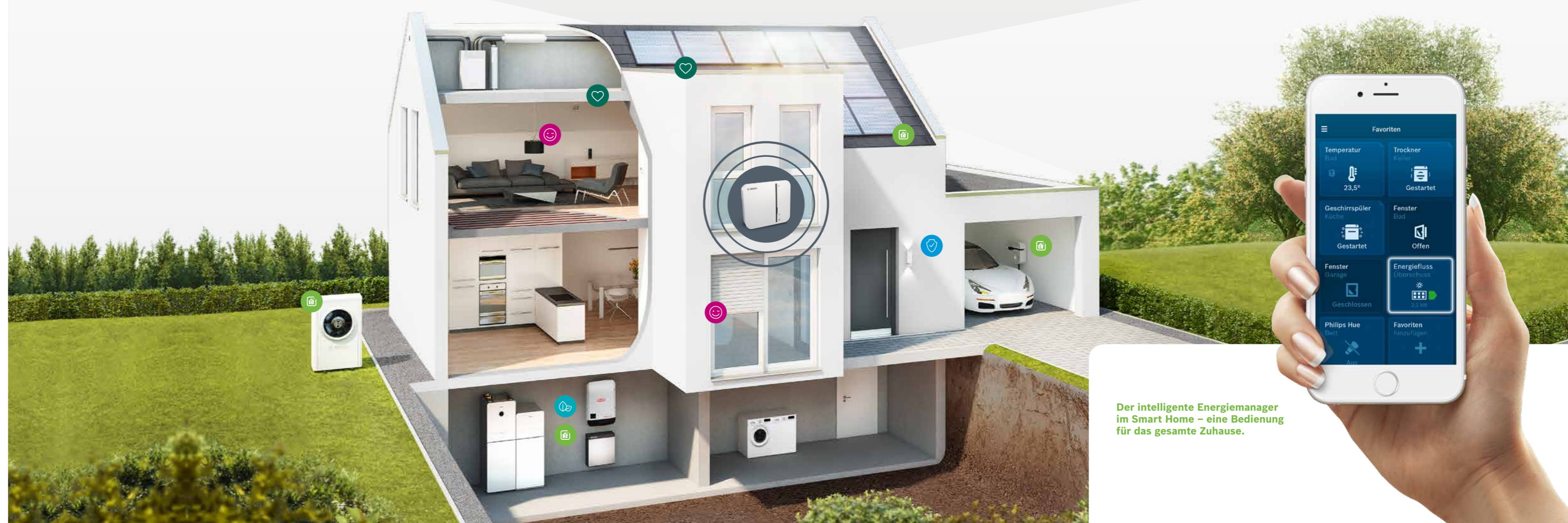
Der intelligente Energiemanager im Smart Home – eine Bedienung für das gesamte Zuhause.